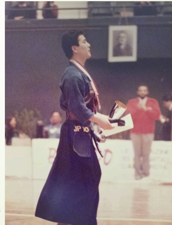
39年前（27歳） 第6回世界剣道選手権大会優勝 パリ（クーベルタン体育館）